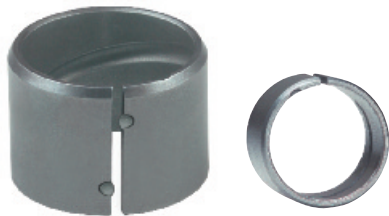
EGPN1 / EGPNG1* Натяжная втулка с прессовой посадкой и выступами