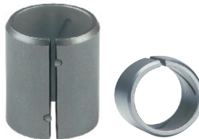
EGPN2 / EGPNG2* Натяжная втулка с прессовой посадкой и выступами