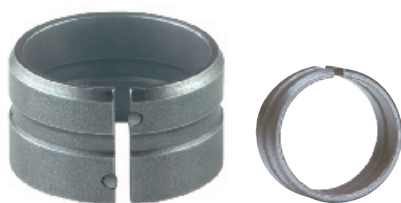
EGPN4 / EGPNG4* Натяжная втулка с прессовой посадкой и выступами