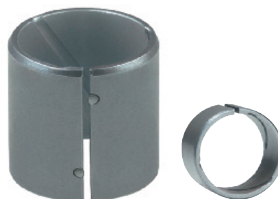
EGPN5 / EGPNG5* Натяжная втулка с прессовой посадкой и выступами