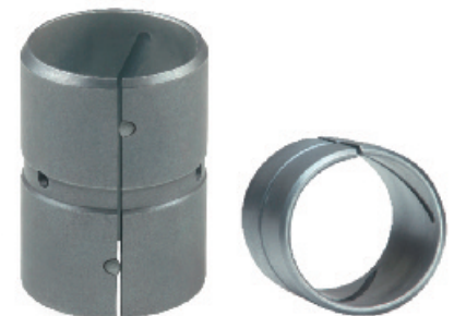
EGPN3 / EGPNG3* Натяжная втулка с прессовой посадкой и выступами