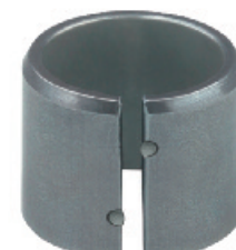
EGPN / EGPNG* Натяжная втулка с прессовой посадкой и выступами